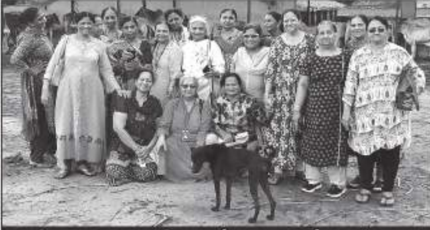
શ્રી અજરામર મહિલા મંડળ - માટુંગા (વેસ્ટ)