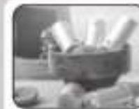
Kaju Kesar Roll