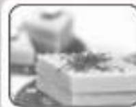
Kesar Kaju Katli