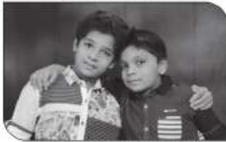
હેત, આર્ચ અશ્વીન ગાલા