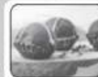
Dark Chocolate Ball