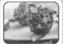
Dryfruit Rose Pettie Ball