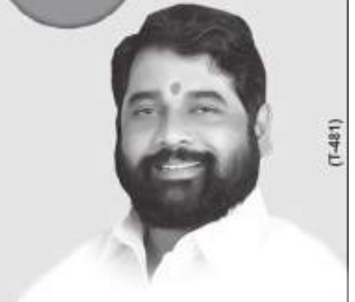
શ્રી એકનાથ શિંદે ૧૪૭ - કોપરી પાંચપખાડી વિધાન સભા ક્ષેત્ર